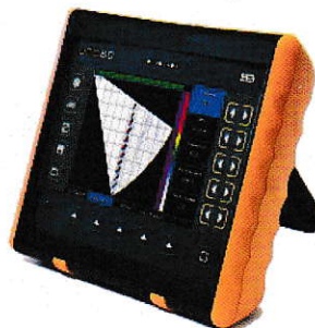
УСД-60, УСД-60ФР, УСД-60.A8